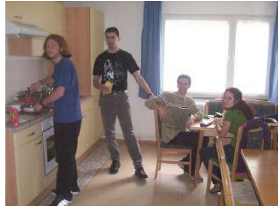
Gruppe spanischer Praktikanten eines europäischen Austauschprogramms in der Küche im 1. OG

Dieses Miteinander ist gewollt und wird von der Heimleitung dadurch zu fördern versucht, indem zunächst die materielle Ausstattung vorgehalten wird. So sind das Vorhandensein der Küchen und Gemeinschaftsräume und deren Attraktivität Voraussetzung für Begegnungen. Darüber hinaus wird durch gezielte Angebote versucht, die Hausgemeinschaft auszubauen und zu stärken. Dies beginnt bei Hausversammlungen, in denen Organisatorisches und Formales besprochen wird. Eingeladen wird zu Video-Abenden sowie zu Skat-, Dart- oder Billard-Turnieren. Das weitere Hausprogramm gestaltet sich so vielfältig wie unsere Hausbewohner/innen selbst, da alle an dessen Ausarbeitung mitwirken und bei dessen Umsetzung teilhaben können.