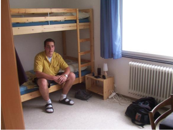
Azubi der Fa. T+S Datentechnik in Zimmer 307

Zum Stichtag der Erstellung dieser Konzeption (1. Juli 2007) sind folgende Schul- bzw. Ausbildungseinrichtungen im Kolpinghaus vertreten: