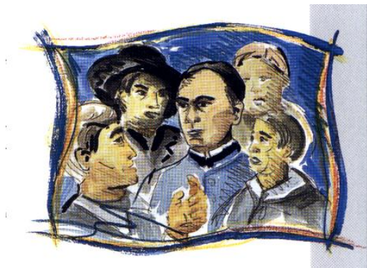
Adolf Kolping umgeben von „Gesellen“

Das Kolpinghaus Pforzheim ist eine Einrichtung, die der katholischen Kirche nahe steht. Getragen wird das Haus zu allermeist von Mitgliedern der Kolpingfamilie Pforzheim, einer Gruppierung innerhalb eines katholischen Verbandes. Auf der