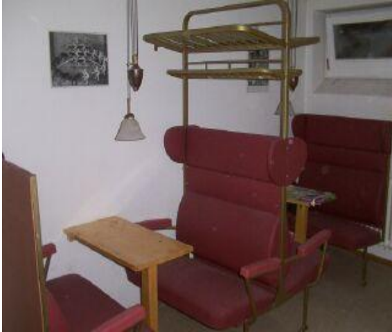
Aufenthaltsraum im UG

Gewerbeschulen, die im Kolpinghaus eine Bleibe suchten, so beherbergen wir heute Schüler/innen, Azubis, Praktikant/innen, Student/innen, junge Menschen, die auf Zeit in Pforzheim arbeiten, und junge Erwachsene mit Problemen und Schwierigkeiten unterschiedlichster Art.