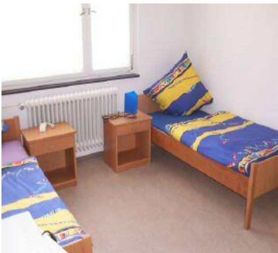
Zimmer 107 (DZ)

Zum Wohnheim gehören auch die Räumlichkeiten im Untergeschoss, in denen sich die Gemeinschafts- und Aufenthaltsräume befinden. Dort besteht die Möglichkeit, im gemütlich eingerichteten Fernsehzimmer Satellitenfernsehen zu empfangen und gemeinsam anzuschauen. Der weitere Aufenthaltsraum ist als Nichtraucherzimmer mit Korbmöbeln und Sitzbänken aus Eisenbahnwaggons eingerichtet und bietet einer kleinen Bibliothek Platz. Er ist Treffpunkt zum gemeinsamen Lernen, kann genutzt werden zum Lesen, um Kicker zu spielen oder gemütlich zusammen zu sitzen und zu reden. Im großen Schulungsraum im EG besteht darüber hinaus die Möglichkeit zum Billardspielen gegen Gebühr.